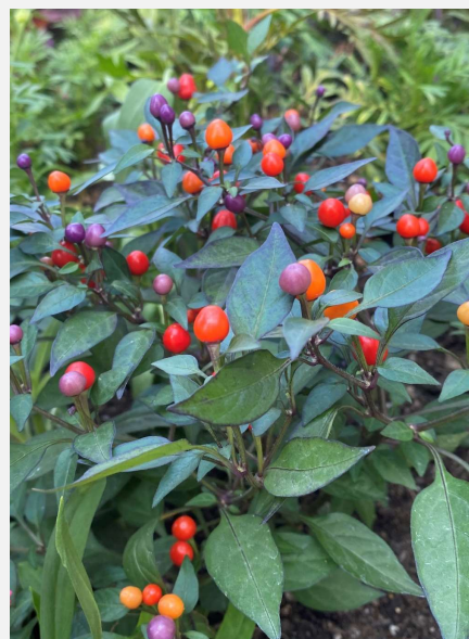
トウガラシ 名古屋市