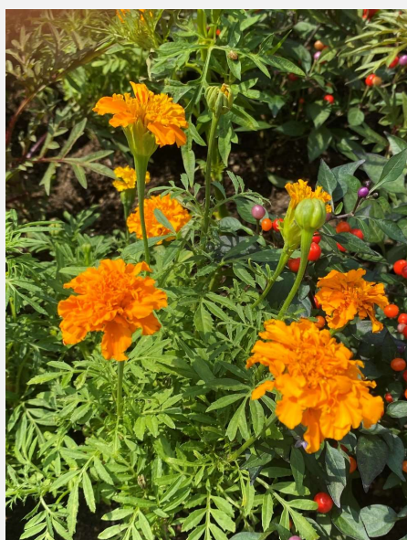
マリーゴールド 一宮市